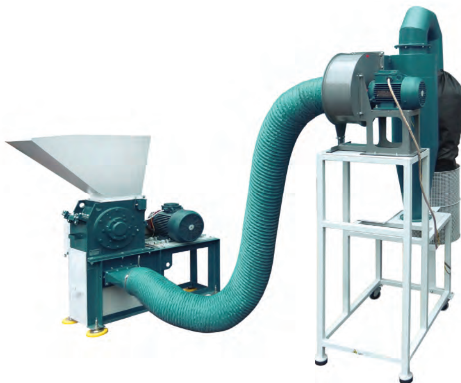
БПУ и Мельница ножевая РМ 250