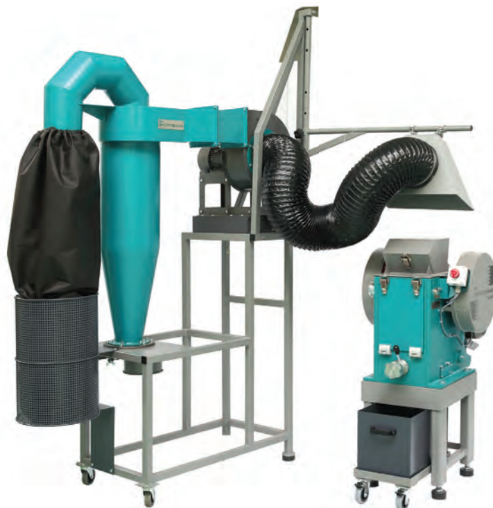
БПУ с зонтом и Дробилка щековая ЩД 10М на опорной тумбе