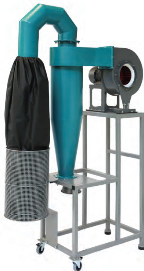
Блок пылеулавливания БПУ